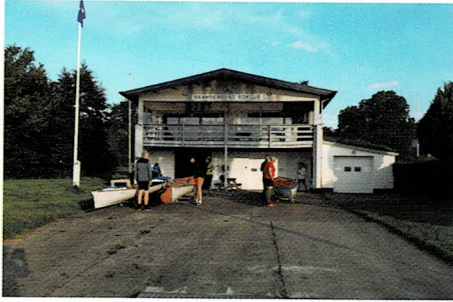
Klargøring for tur