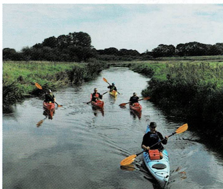
Kongeåsturen, på vej mod Frihedsbroen, hvor billedet er taget fra