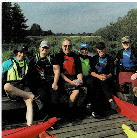
Kongeåsturen ved startstedet (Vejen Fodboldgolf)

Siden opstarten af klubbens nye havkajakafdeling sidste år er det gået støt og roligt fremad. I 2023 har vi fået 10 nye medlemmer, så afdelingen nu er oppe på 15 aktive kajakroere.